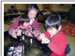
お正月だよ! 工作教室の様子 コマ、竹とんぼ、ヨーヨーを 作りました。

開催日: 毎月第3日曜日 時間: 14時~15時 場所: 大広間 参加費: 無料 2月) 折り紙でお雛様を作ろう 3月) 飛び跳ねる! おもちゃ 4月) こいのぼり&かぶと作り