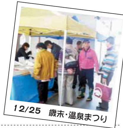
12/25 歳末・温泉まつり

12月25日(日)に関金都市交流センターで、「歳末・温泉まつり」を開催。当日の朝に瀬戸内海の市場から仕入れた鰯、鯛、蟹カレイ、牡蠣などの海産物の販売や湯命館恒例のフリーマーケット、ぶり丼、豚汁の販売、綿菓子作り体験などを行いました。