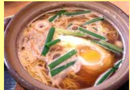
鍋焼き牛骨ラーメン 780円 ラーメンを食べた後にスープと頂く 「おじゃやセット(150円)」も大好評!