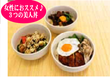
女性におすすめ♪ 3つの美人丼