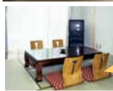
個室もご利用 いただけます (2時間1,500円)