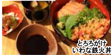
とろろがけ いわな鉄火丼